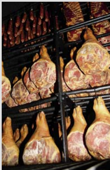
«Burehammen» verlangen viel Arbeit und Geduld, bevor man sie als Delikatessen geniessen kann: In der Dorfmetzgerei Walther hängen die Schinken zwischen fünf und sieben Wochen im Küchenrauch.

Seit mehr als 100 Jahren werden in der Dorfmetzgerei echte Emmentaler «Burehammen» hergestellt. Die Schinken werden Woche für Woche mit einer Salz- und Gewürzmischung von Hand umgesalzen. Dies verlangt handwerkliches Geschick und jahrelange Erfahrung.