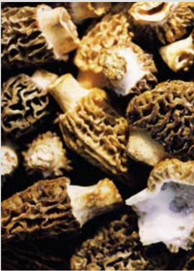
Frische Morcheln machen der Spargel und dem Bärlauch den Feinschmecker-Frühling streitig.

Mit etwas Wetterglück ist der aromatische Schlaupilz mit dem hohlen, braunen Hut bereits anfangs April erhältlich.