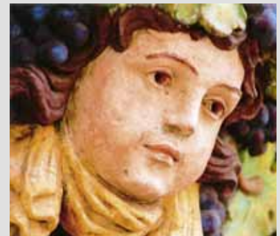
Bacchus – Gott des Weins.

Bacchus ist der römische Gott des Weins, den die Griechen als Dionysos bezeichneten. Auch wenn dieser als Schutzpatron des Weins eine wichtige Rolle spielt, ist er auch als Rebsorte bekannt, die 1933 am Institut für Rebenzüchtung Geilwieslerhof aus Silvaner x Riesling und Müller-Thurgau gekreuzt wurde. Bacchus-Weine zeichnen sich durch einen fruchtigen Charakter aus. Die Traube verdankt ihre Popularität bei den Winzern der Tatsache, dass sie – im Gegensatz zum Riesling – eine frühreifende Rebsorte ist, die hohe Reifegrade erreicht und deshalb auch in Lagen angebaut werden kann, die für den Riesling ungeeignet sind. Angebaut wird die Bacchus-Traube (oder Frühe Scheurebe) vor allem in Deutschland und England.