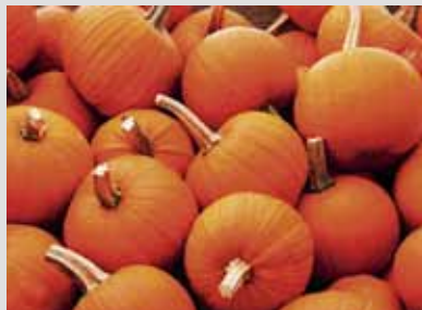
Orangefarbener Kürbis, ein Herbstbote par excellence.

Wenn die Tage kürzer werden und es draussen kühler wird, dann ist es höchste Zeit, die körpereigenen Abwehrkräfte zu festigen – denn die Grippewelle kommt bestimmt. Dies gelingt auf einfache Art und Weise, mit farnefrohem Herbstgemüse: Orangefarbener Kürbis, gelbe Rüben, violettes Rotkraut, grüner Wirz und viele weitere der knackigen Ge-