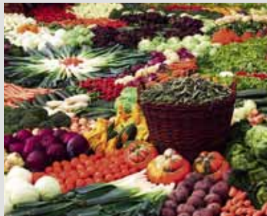
In jedem der bunten Herbstgemüse steckt ein anderer Mix an Vitaminen und wertvollen Mineralstoffen.

Wer seinem Körper im Herbst etwas Gutes tun will, der ernährt sich abwechslungsreich mit buntem Gemüse: Gesunde Vitamine und Pflanzenstoffe unterstützen das Immunsystem, und die schönen Farben sind gut für das Gemüt.