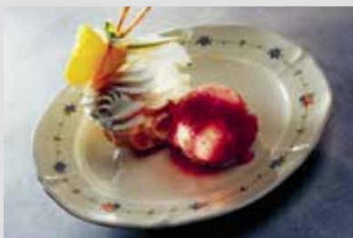
Gebackene «Eiweisschalen», sprich Meringues, präsentieren sich so als das wohl beliebteste «Bären»-Dessert.

Aber auch «gluschtige» Torten, Pralinen, Pastetli und viele Schokoladespezialitäten sowie originelle und dekorative Tischdekorationen finden ihren Weg über die Marktgasse. Zur grossen Freude unserer Köche und vor allem unserer Gäste.